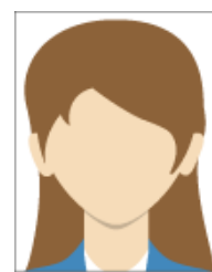
Esempio inquadratura foto personale

5) Prenota la visita medica (scegliendo tra tutte le nostre sedi)